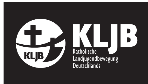
Logo in vollflächig Schwarz-Weiß, negativ