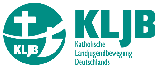
Logo nach dem Relaunch 2006