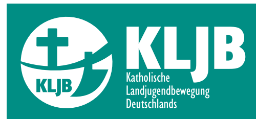
Abb. 3 Zusätzlich besteht die Möglichkeit, im Bedarfsfall das Logo als Negativdarstellung zu verwenden