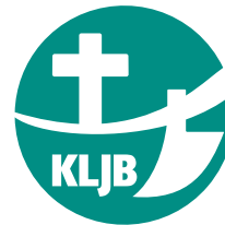
Abb. 2 Verwendung dieses Logos in besonderen Fällen: auf Aufklebern, Stempel, Fahnen und Pins