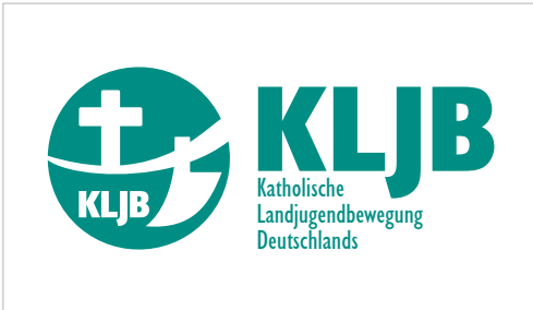
Logo der Bundesstelle mit Zusatz „Deutschland“