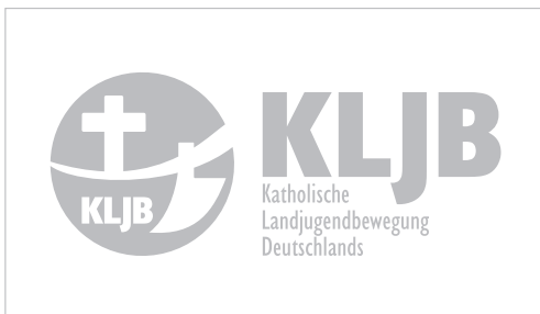
Logo in Grau, positiv (Rasterung: 30%-Tonwert von Schwarz) (nur in Ausnahmefällen)