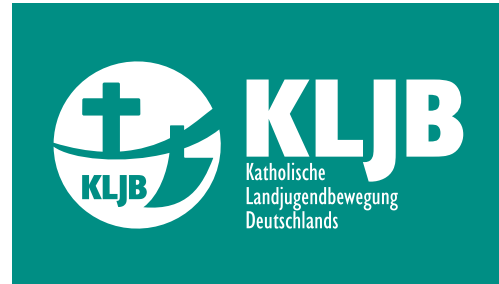
Logo in HKS 59, negativ