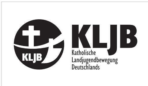
Logo in vollflächig Schwarz-Weiß, positiv