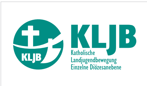
Logo der einzelnen Diözesanebenen