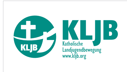
Logo neutral mit Zusatz „www.kljb.org“