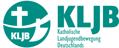
Abb. 1 Reguläre Verwendung des Logos mit fest positioniertem Typozusatz: Veröffentlichungen, Schriftverkehr, Prospekten, Plakaten, ...

Das Logo wird allen graphischen Anforderungen gerecht: zeitloses Design, klare Formsprache, Einfachheit, Einprägsamkeit und Unverwechselbarkeit. Durch die klare Botschaft, die das Logo vermittelt, ist eine hohe Wiedererkennung gegeben. Dies wird noch durch die wiederverwendete Farbe von 1994 verstärkt.