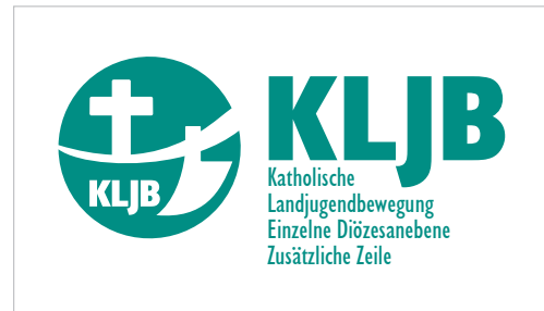
Logo vereinzelter Diözesanebenen, deren Bezeichnung eine zusätzliche Zeile benötigt