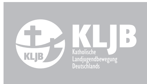
Logo in Grau, negativ (Rasterung: 30%-Tonwert von Schwarz) (nur in Ausnahmefällen)